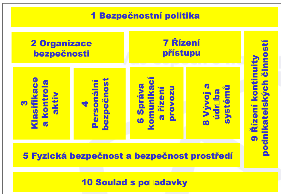
Obr. 2 Struktura BS 7799 - 1

Standard ISO/IEC 17799:2000 při řešení této problematiky mohou využít všechny organizace, bez ohledu na velikost nebo zaměření,